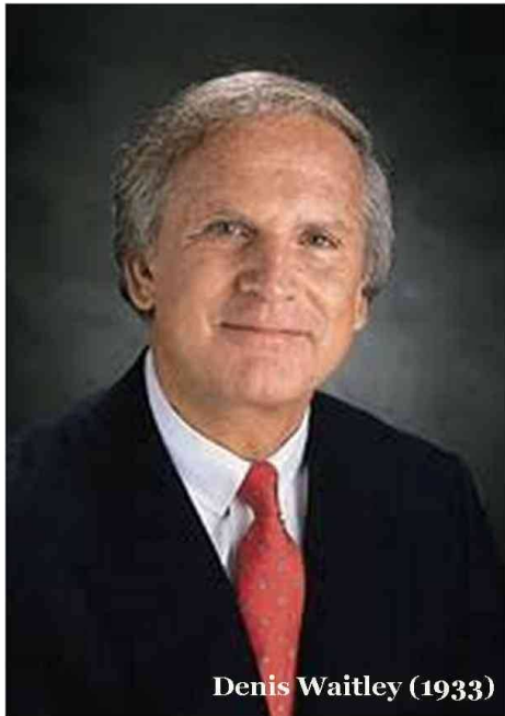
Denis Waitley (1933)

Artículo 19º.- Aquí pudimos comprobar por medio de los resultados de los trabajos encargados por la NASA, dentro del programa Apolo, al Dr. Denis Waitley, con algunos de los deportistas, que participarían en las siguientes olimpiadas que: